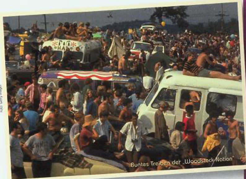
Buntes Treiben der „Woodstock Nation“